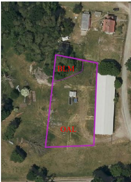
Abb. 2: Biotoptypen im Plangebiet

Aus den bestehenden Habitaten ergeben sich an untersuchungsrelevanten Arten bzw. Artengruppen Brutvögel und Reptilien (Zauneidechsen).