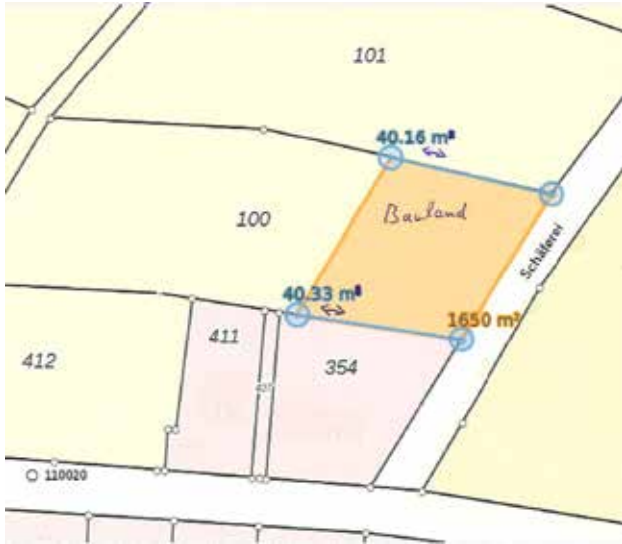
Abb. Lageskizze Ergänzungssatzung „Sauen 1“

Wie sich aus dem vorliegenden Flurkartenauszug ergibt, ist geplant ein ca. 1.650 m 2 großen Teil des Flurstückes in den Innenbereich nach §34 BauGB einzubeziehen.