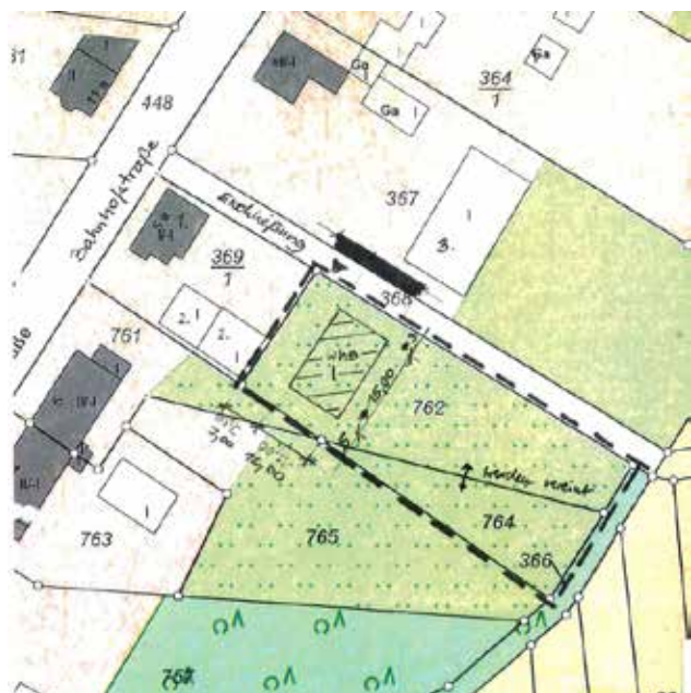
Abb. Lageskizze Ergänzungssatzung „Bahnhofstraße“

Der Geltungsbereich wird eine Größe von ca. 1.700 m 2 aufweisen, wovon ca. 600 m 2 als Bauland ausgewiesen werden sollen.