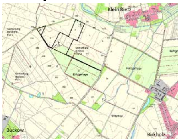
Abbildung: Lage des Geltungsbereichs (schwarze Umgrenzung) der Aufhebungssatzung zum Vorhabenbezogenen Bebauungsplan „Windpark Birkholz“; DTK10 © GeoBasis-DE/LGB, dl-de/by-2-0

Die Lage des Geltungsbereichs ist in der nachfolgenden Abbildung dargestellt. Er umfasste im Jahr 2001 in der Gemarkung Birkholz, Flur 2, die Flurstücke 113, 115, 108 und 100. Die Flurstücksbezeichnungen haben sich geändert, der Geltungsbereich umfasst nach aktueller Benennung in der Gemarkung Birkholz, Flur 3, die Flurstücke 2, 3 und 10 vollständig und die Flurstücke 7, 8, 9, 11, 12 teilweise.