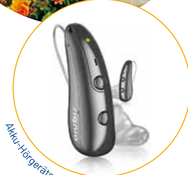
Akku-Hörgeräte von SIGNIA