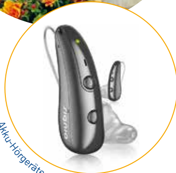
Akku-Hörgeräte von SIGNIA