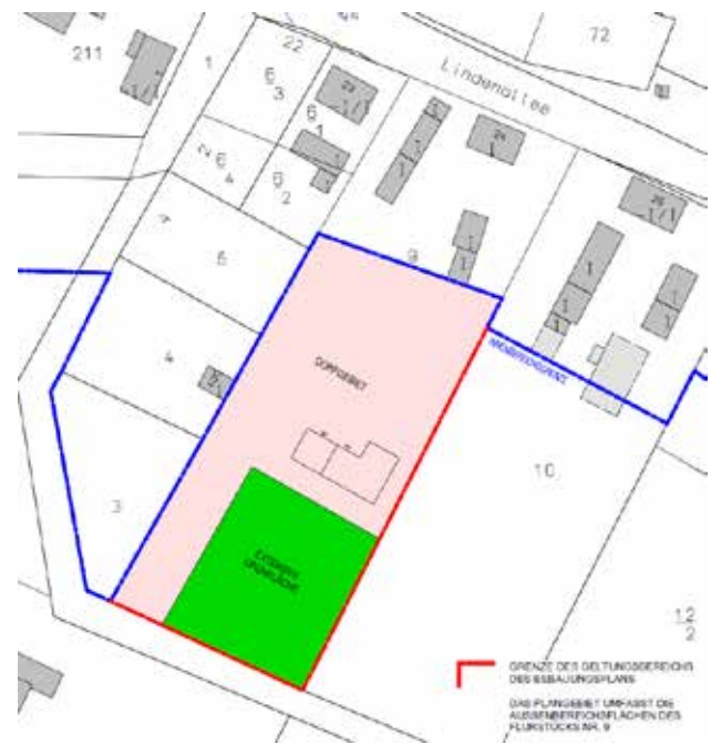
Abbildung: Lage des Plangebiets

Wie sich aus dem vorliegenden Flurkartenauszug des Planners ergibt, ist geplant ein ca. 6.000 m 2 großen Teil des Flurstückes in den Innenbereich nach §34 BauGB einzu-beziehen.