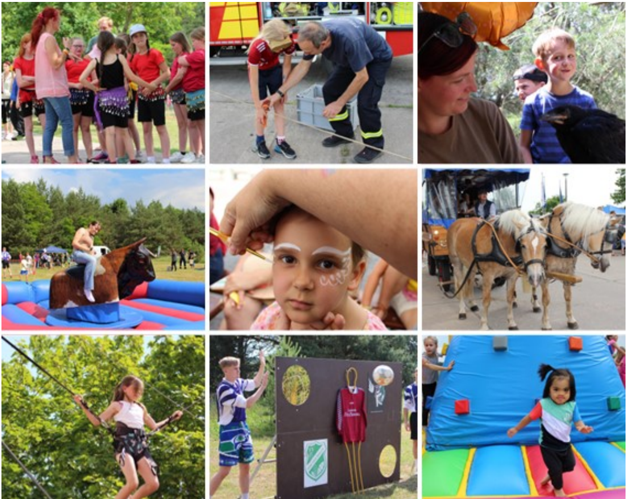
Eindrücke vom 14. Kinderfest am 01. Juni 2024

Bürgermeister der Gemeinde Rietz-Neuendorf